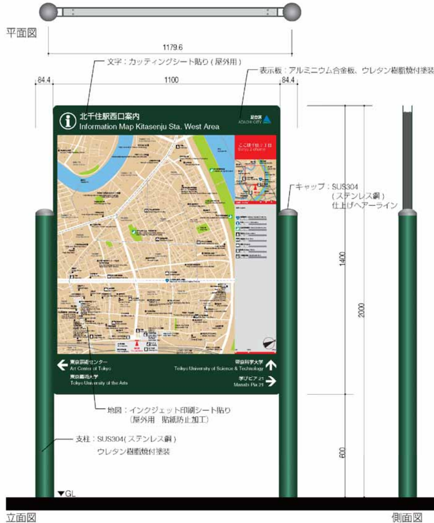
■広域案内サイン背面表示例（サンプルデータ：イラストレーター CS3 ファイル名：広域千住背面）